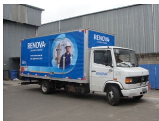
FROTA COM NOVA IDENTIDADE VISUAL