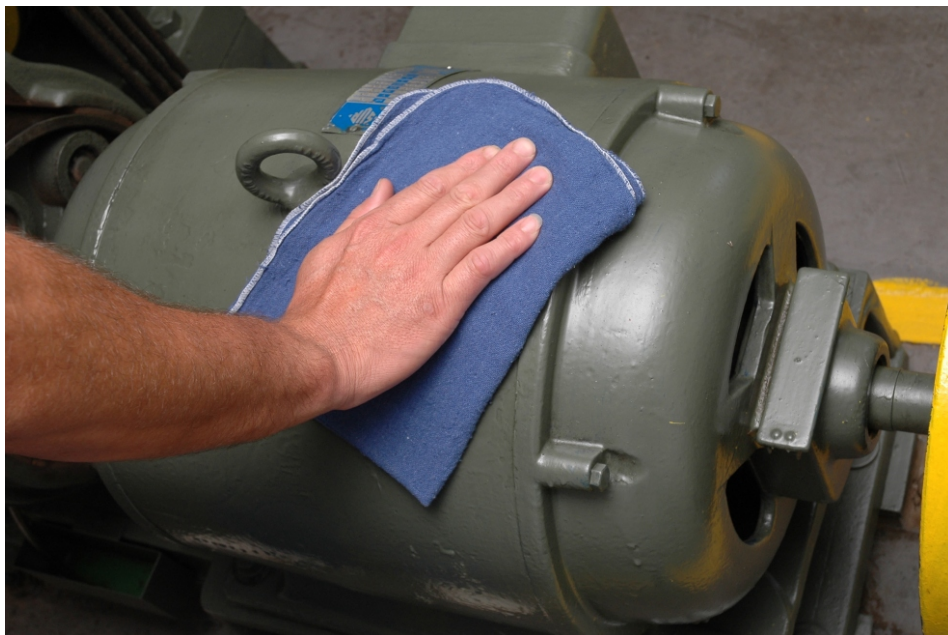
EMPRESA BUSCA CONTRIBUIR PARA A REDUÇÃO DO IMPACTO AMBIENTAL

Joarez Venço - No sistema de locação a Renova disponibiliza quantidades predeterminadas de toalhas ao cliente, substituindo periodicamente as usadas por outras devidamente higienizadas. O