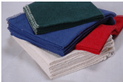
TOALHAS INDUSTRIAIS PRODUZIDAS PELA RENOVA

empresas escolhem o setor de almoxarifado das empresas como o local para guarda dos estoques de toalhas limpas, e também para receber as toalhas já utilizadas. Essa medida, além de contribuir para o giro das peças, garante também o seu controle, evitando os extravios.